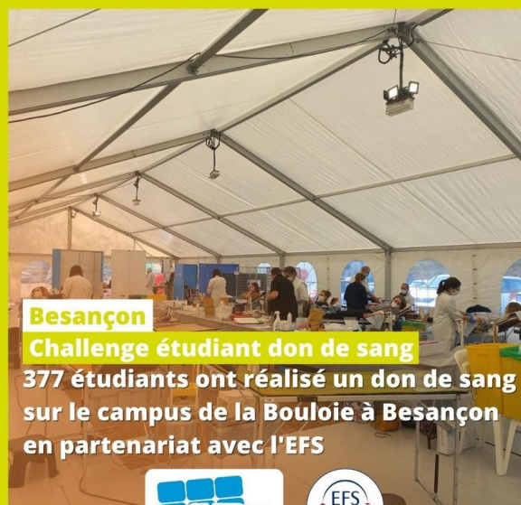
Besançon Challenge étudiant don de sang 377 étudiants ont réalisé un don de sang sur le campus de la Bouloie à Besançon en partenariat avec l'EFS