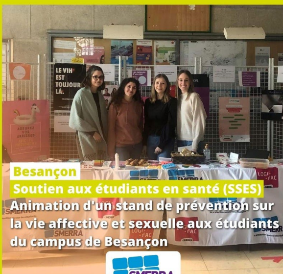
Besançon Soutien aux étudiants en santé (SSES) Animation d'un stand de prévention sur la vie affective et sexuelle aux étudiants du campus de Besançon