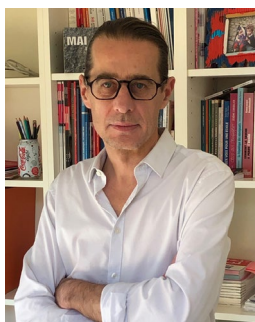
Par Nicolas Delesque Directeur de la rédaction

Expérience étudiante, vie étudiante, bien-être étudiant, engagement... et santé étudiante : autant de termes qui surgissent ces derniers mois dès qu'il est question d'enseignement supérieur.