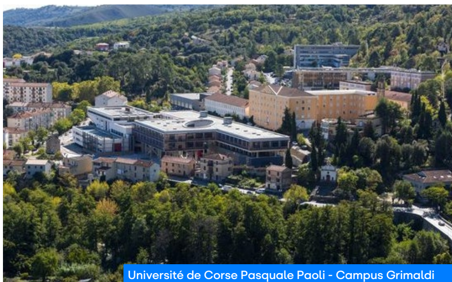
Université de Corse Pasquale Paoli - Campus Grimaldi

■ Pages 3/4 : Metz : La Dragonne inaugure son antre ■ Page 6 : La mobilité des étudiant(e)s sages-femmes ■ Pages 7/8 : AVUF : le Réseau européen des villes universitaires ■ Pages 9/10 : Eiffage : une opération pour l'IUT A de Villeneuve d'Ascq ■ Pages 11/12 : SMERRA : l'Agitateur, quatrième édition ! ■ Pages 13/14 : ESN France : pour une mobilité de tous les jeunes ■ Page 15 : Loger étudiants et internationaux dans le Grand-Nancy ■ Pages 16/17 : Projet Rebond : intervenir à nouveau en milieu carcéral ■ Pages 18/19 : En Corse, le Crous renforce son partenariat avec la Collectivité ■ Pages 20/21 : Faut-il souffrir pour mériter son doctorat ?